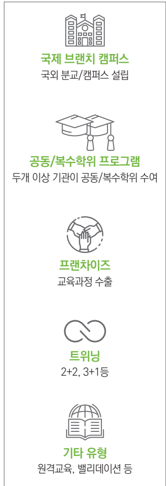
〈그림 3〉 TNE 유형 분류