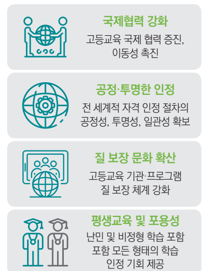
〈그림 3〉 글로벌 협약 주요 목표