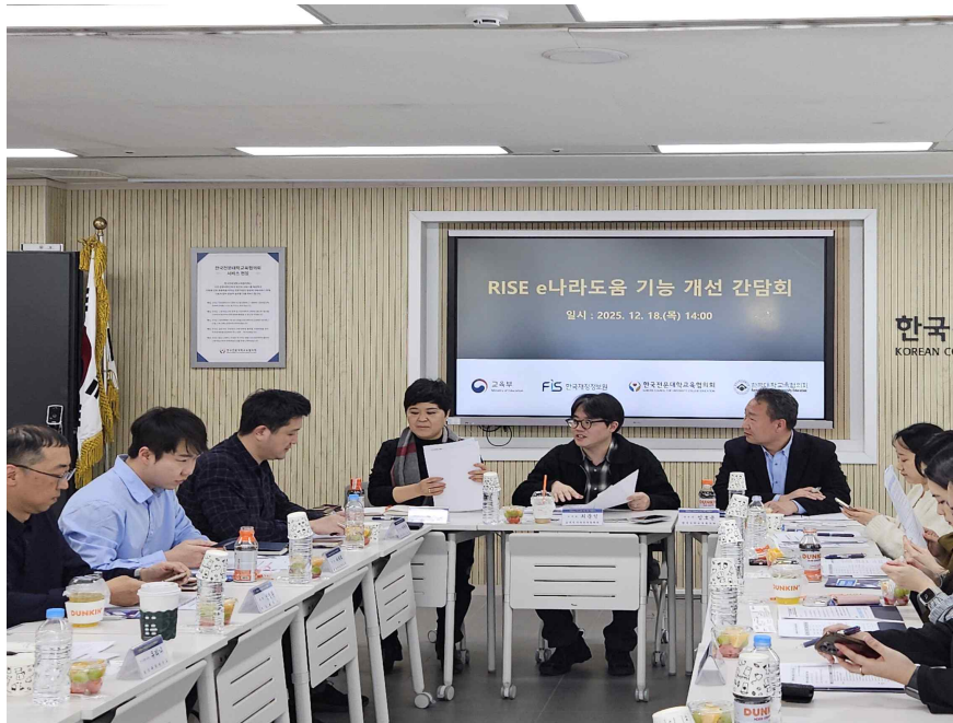
<RISE 사업비 집행 효율화를 위한 e나라도움 시스템 기능 개선 간담회 개최 현장>